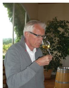
Jan med näsan i glaset — en ädelsöt Sauternes från Chateau Rieussec